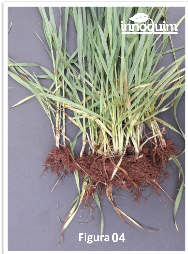
Figura 04: tratamiento de productor, la planta presenta hojas mas amarillentas, evidencia de plantas afectadas al stress hídrico que tuvimos en un período de 30 días.