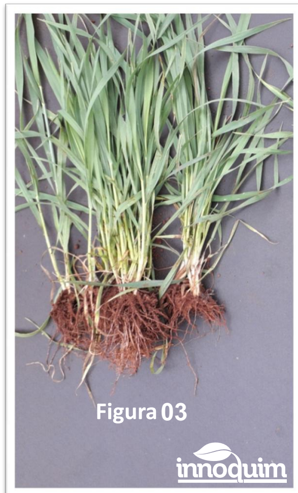
Figura 03: tratamiento con FORZA , las plantas presentan mayor sanidad, no presentan hojas amarillentas, en cuanto a raíz, podemos ver un mejor desarrollo y fasciculadas.